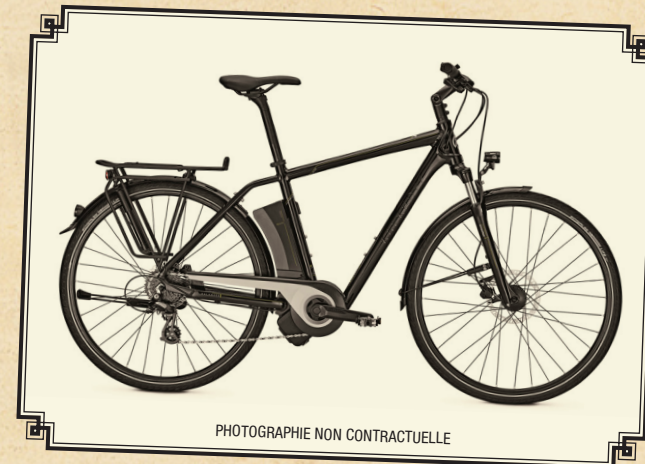
PHOTOGRAPHIE NON CONTRACTUELLE