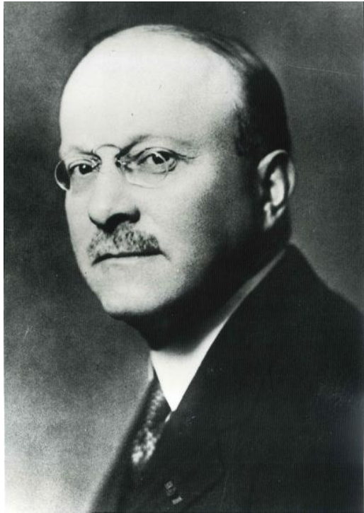
André Citroën (1878-1935)