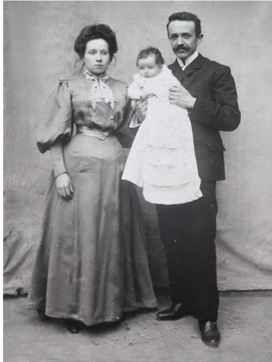
Les parents d'Adolphe Kégresse

Exposition réalisée par "Les Ateliers Découvertes" Avec le soutien de la Ville d'Héricourt et de la Communauté de Communes du Pays d'Héricourt