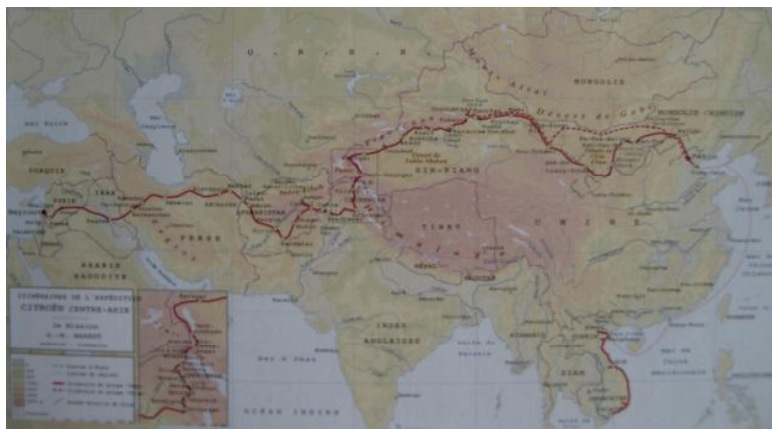
Trajet de la Croisière Jaune