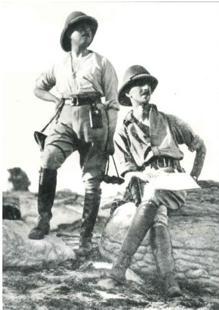
Georges-Marie Haardt et Louis Audouin-Dubreuil

Le périple aura duré presque un an et la mission a parcouru environ 20 000 kilomètres. Ce fut un succès considérable.