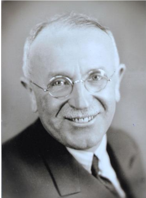
Dernière photo connue d'Adolphe Kégresse