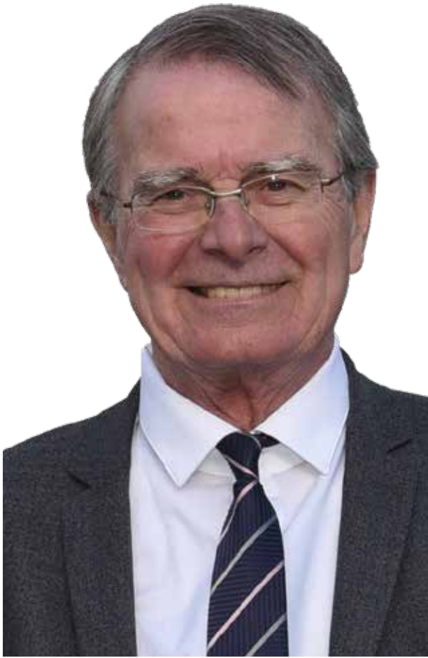
Fernand BURKHALTER Maire d'Héricourt, Président de la Communauté de Communes du Pays d'Héricourt.